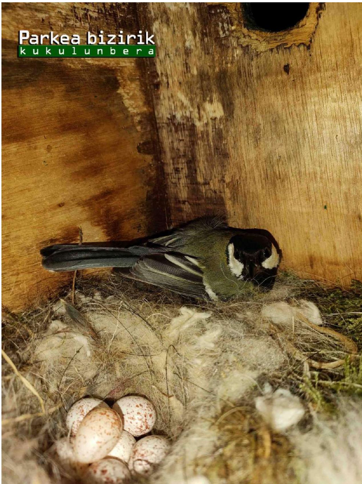
KASKABELTZ HANDI EMEA ETA BERE HABIA ( Parus major )