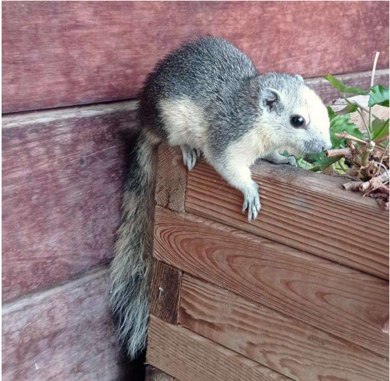
Indotxinako katagorria ( Callosciurus finlaysonii ).