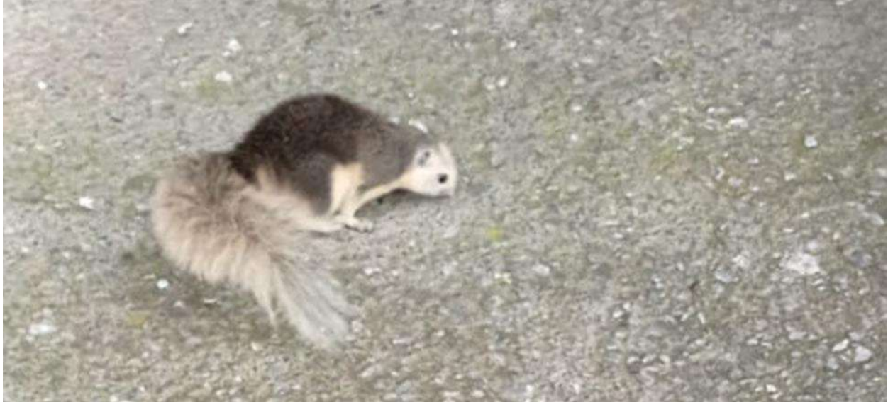
Indotxinako katagorria ( Callosciurus finlaysonii ).